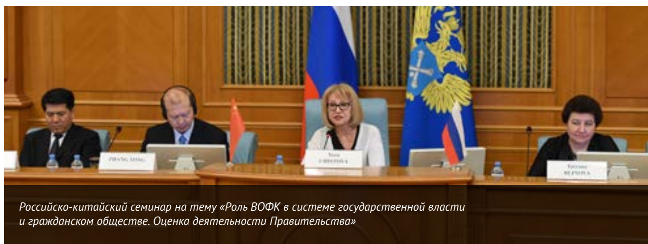
Российско-китайский семинар на тему «Роль ВОФК в системе государственной власти и гражданском обществе. Оценка деятельности Правительства»

Счетная палата осуществляет свою международную деятельность в соответствии с Федеральным законом «О Счетной палате Российской Федерации», положениями Лимской и Мексиканской деклараций Международной организации высших органов финансового контроля (ИНТОСАИ), на основе Плана мероприятий по обеспечению международного сотрудничества Счетной палаты.