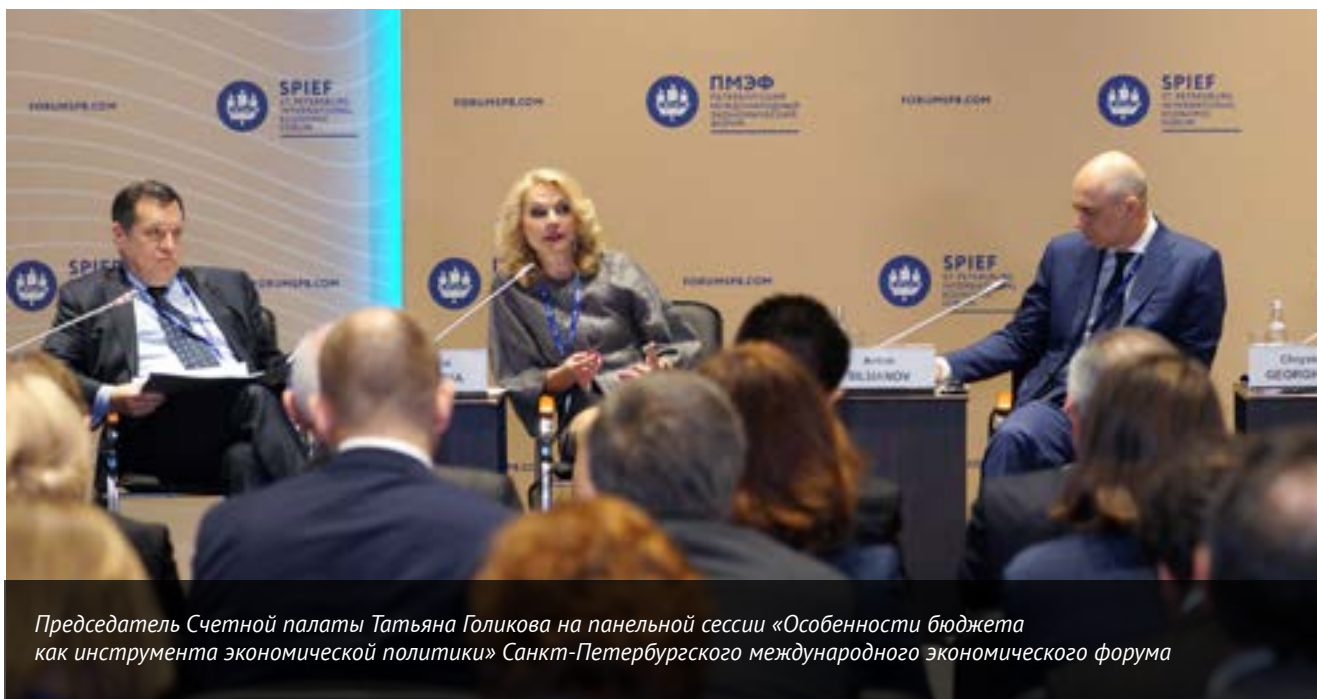
Председатель Счетной палаты Татьяна Голикова на панельной сессии «Особенности бюджета как инструмента экономической политики» Санкт-Петербургского международного экономического форума

Стратегия деятельности Счетной палаты на 2013 – 2019 годы предусматривает обеспечение информационной открытости ведомства, повышение прозрачности и подотчетности обществу.