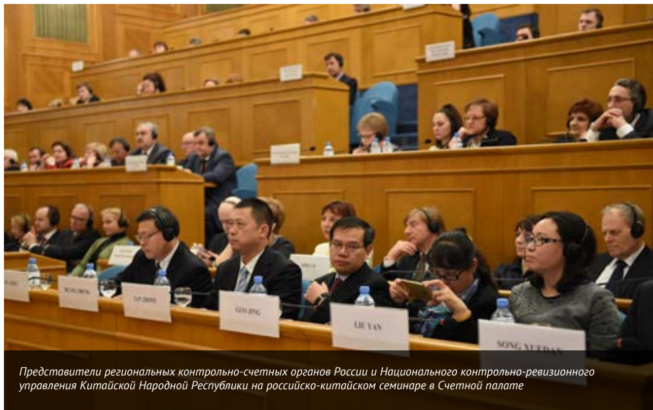
Представители региональных контрольно-счетных органов России и Национального контрольно-ревизионного управления Китайской Народной Республики на российско-китайском семинаре в Счетной палате

Кроме того, Счетная палата приняла активное участие в создании международного стандарта по сбору аудиторских доказательств, разработка которого ведется в рамках технического комитета Международной организации по стандартизации (ISO/PC 295).