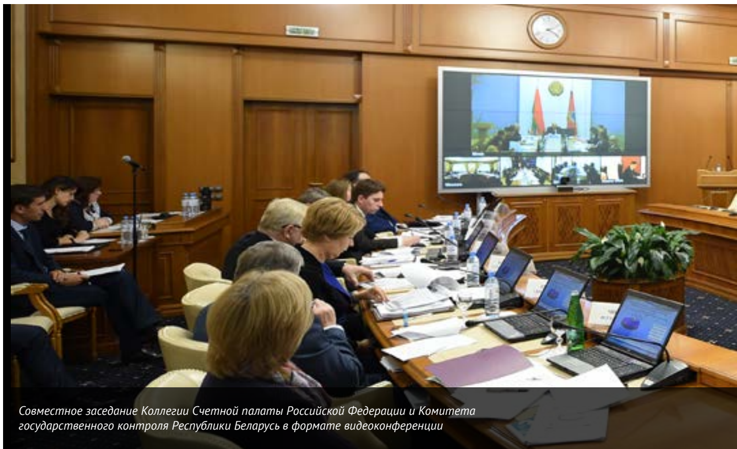
Совместное заседание Коллегии Счетной палаты Российской Федерации и Комитета государственного контроля Республики Беларусь в формате видеоконференции

В июне 2016 года делегация Счетной палаты приняла участие во II Международном семинаре по аудиту, контролю и проверке (Гавана, Куба). В рамках мероприятия в ходе двусторонних переговоров представителей руководства ВOA России и Кубы были закреплены договоренности о проведении параллельных контрольных мероприятий по тематике гражданской авиации в 2017 году, а также по тематике энергетики в 2018 году.