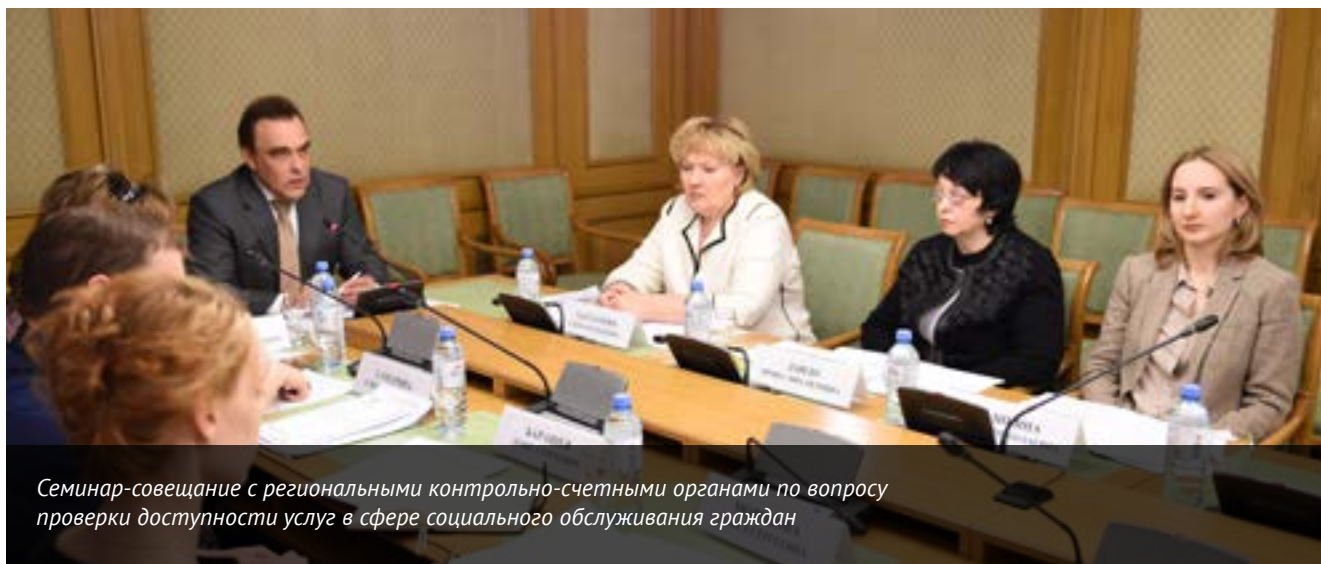
Семинар-совещание с региональными контрольно-счетными органами по вопросу проверки доступности услуг в сфере социального обслуживания граждан

Комиссией также проанализирован опыт КСО муниципальных образований по проведению проверок в сферах жилищно-коммунального хозяйства, управления и распоряжения имуществом, находящимся в муниципальной собственности, а также доработана форма «Основные показатели деятельности контрольно-счетных органов субъектов Российской Федерации» с учетом введения Классификатора.