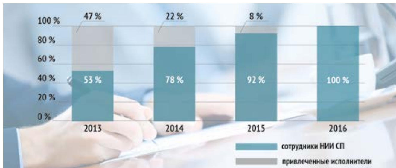
Выполнение плана НИИ СП в 2013 – 2016 годах

Все НИР выполнены собственными силами Института с привлечением в отдельных случаях внешних экспертов.