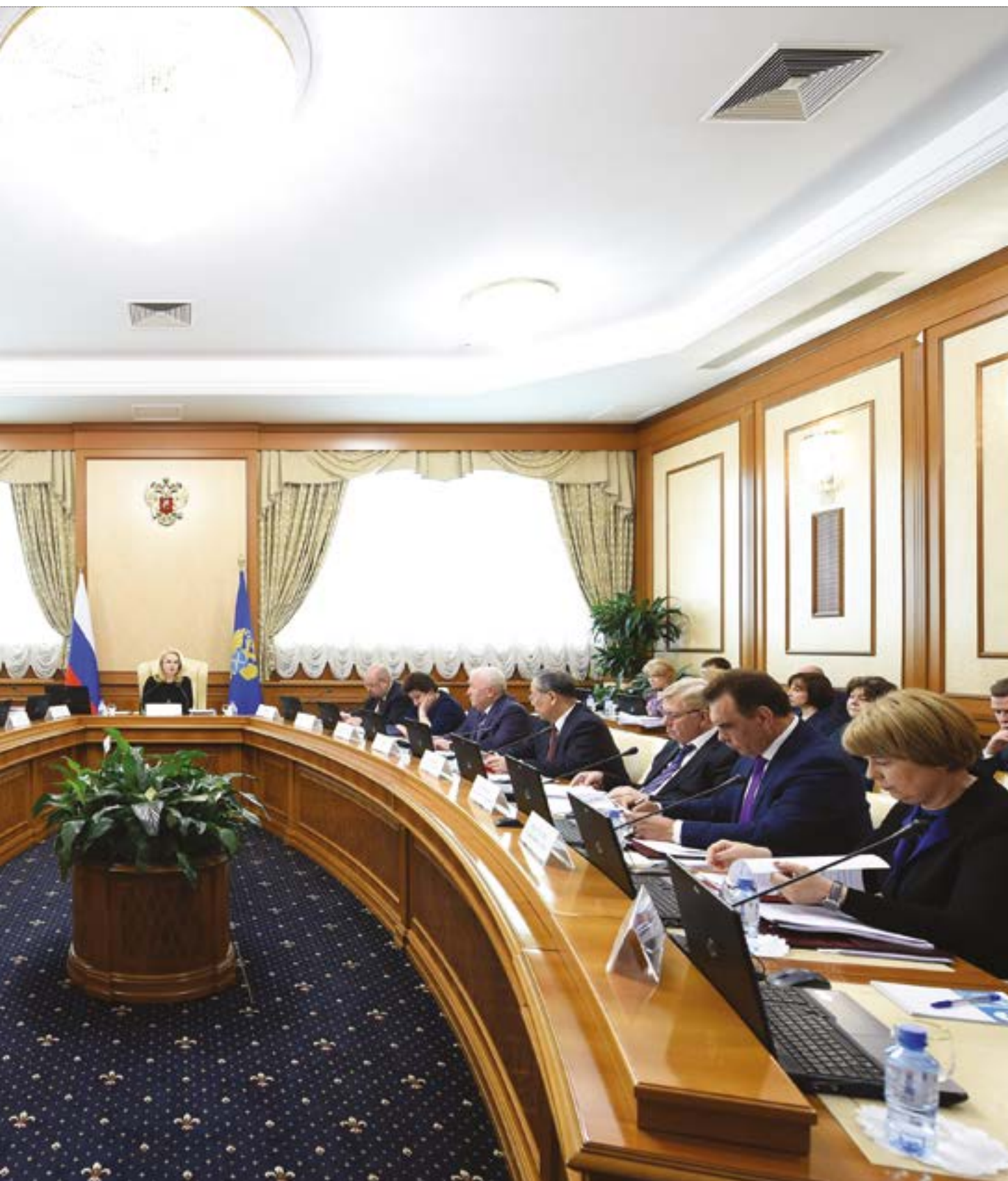
Заседание Коллегии Счетной палаты