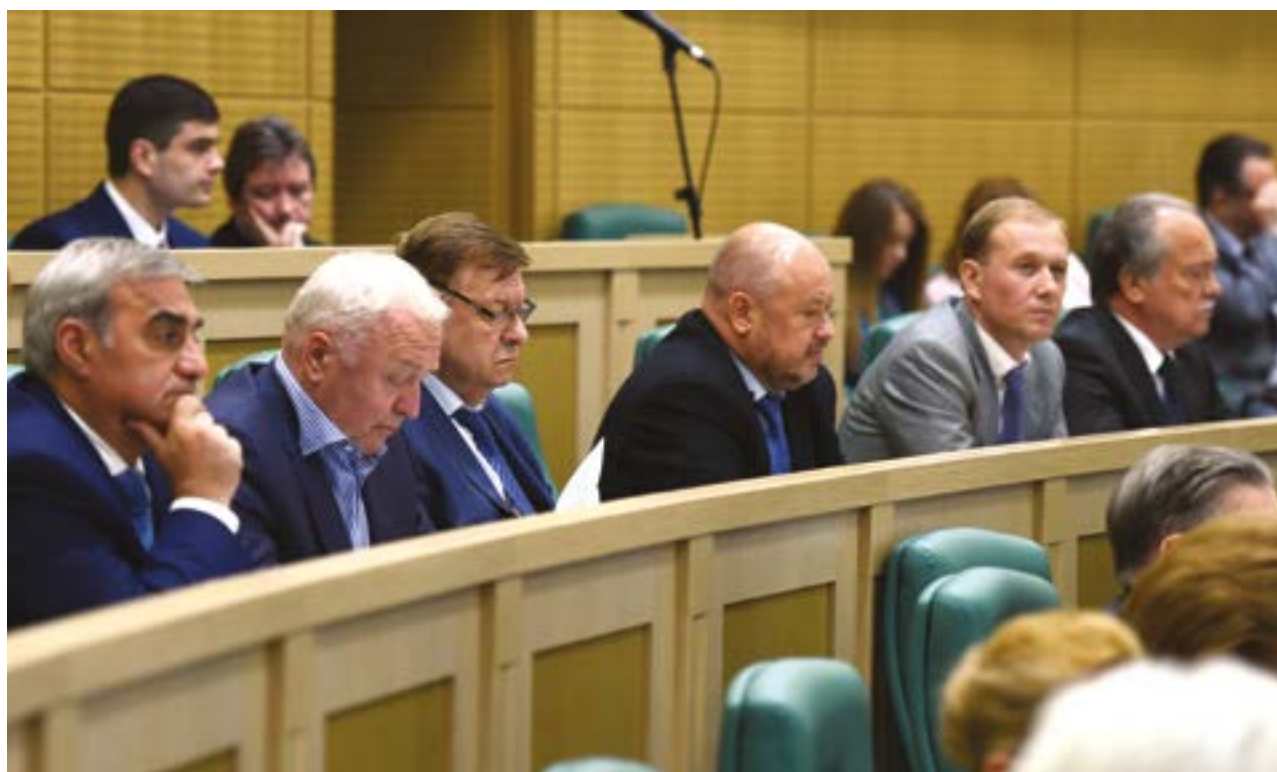
Аудиторы Счетной палаты на заседании Совета Федерации, посвященном отчету о работе Счетной палаты за 2016 год