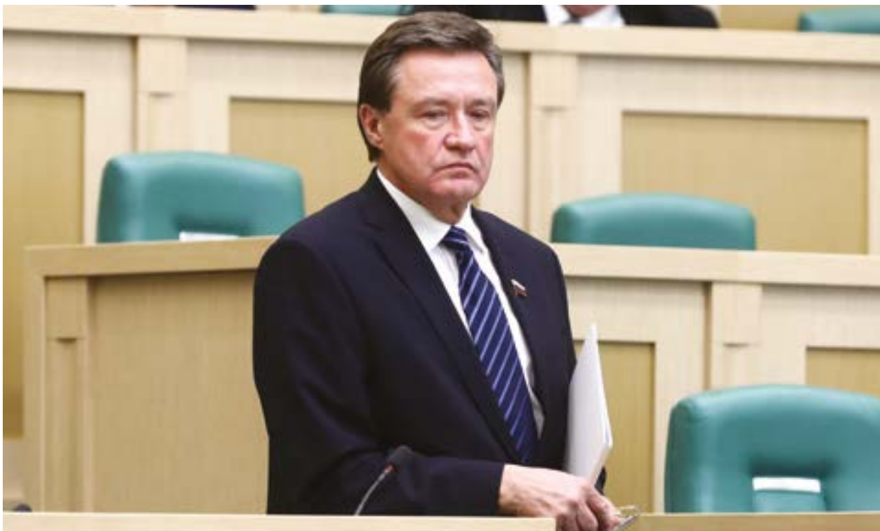
Председатель Комитета Совета Федерации по бюджету и финансовым рынкам Сергей Рябухин