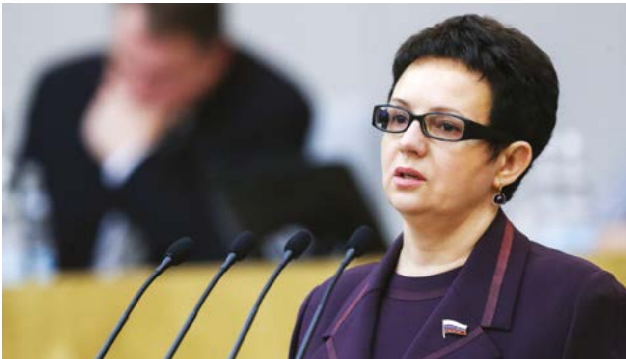
Председатель Комитета Государственной Думы по контролю и Регламенту Ольга Савастьянова