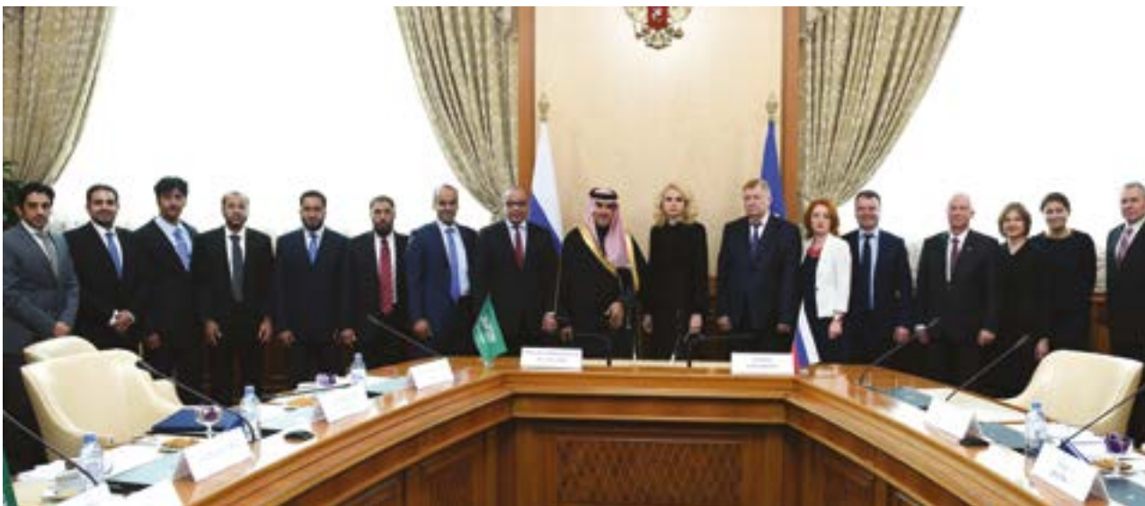
Счетная палата и Генеральное бюро по аудиту Саудовской Аравии подписали Меморандум о взаимопонимании по вопросам сотрудничества в области аудита

ЕАЭС. В интересах развития методологической базы проводимой работы по инициативе Председателя Счетной палаты начала действовать рабочая группа по совершенствованию взаимодействия высших органов аудита государств – членов ЕАЭС.