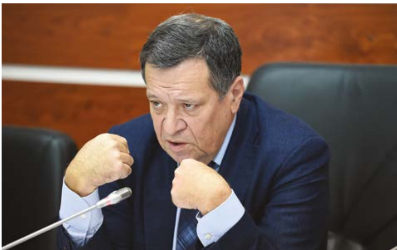
Председатель Комитета Государственной Думы по бюджету и налогам Андрей Макаров