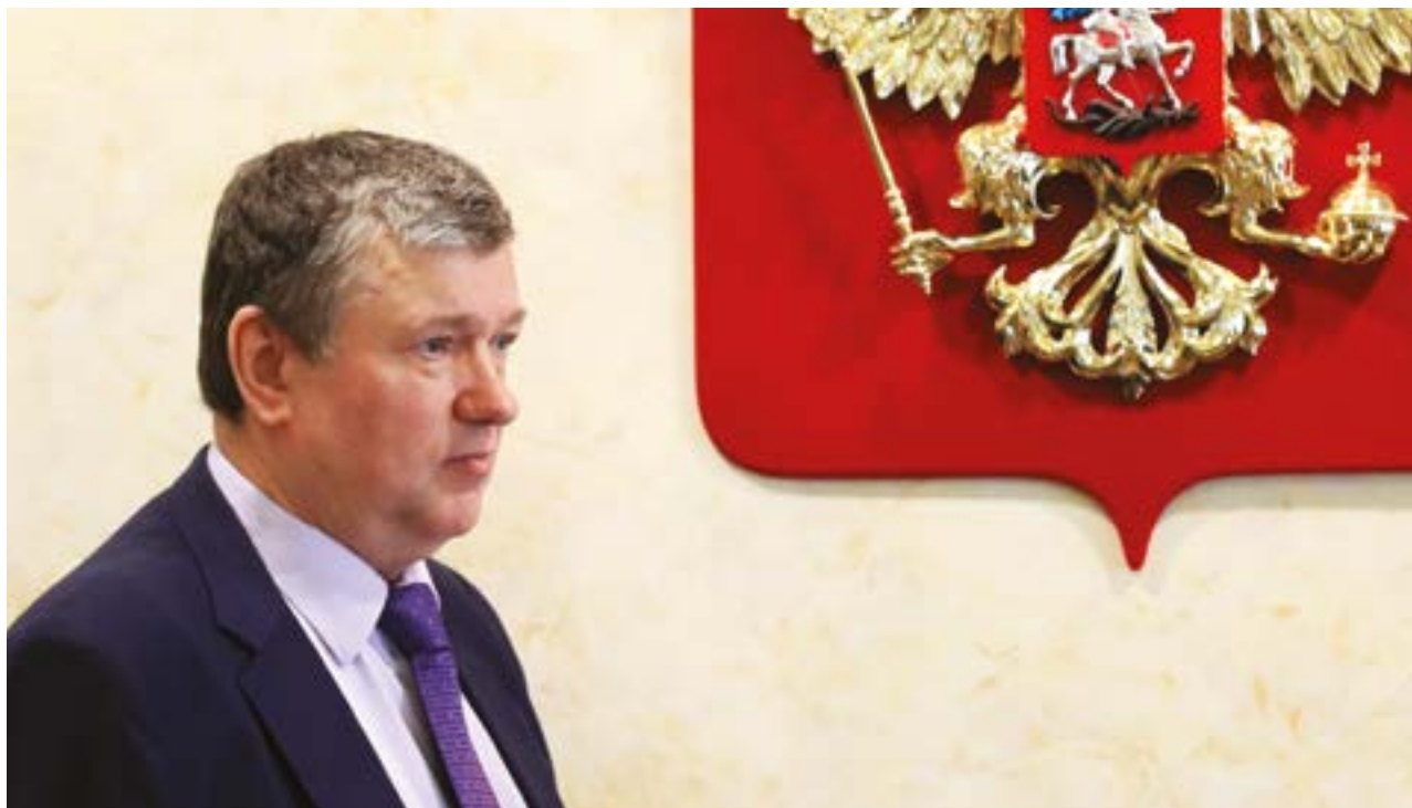
Заместитель Председателя Совета Федерации Евгений Бушмин перед началом заседания Межрегионального банковского совета