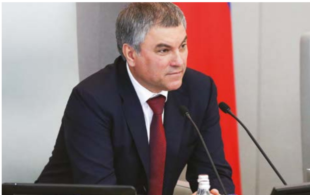
Председатель Государственной Думы Вячеслав Володин