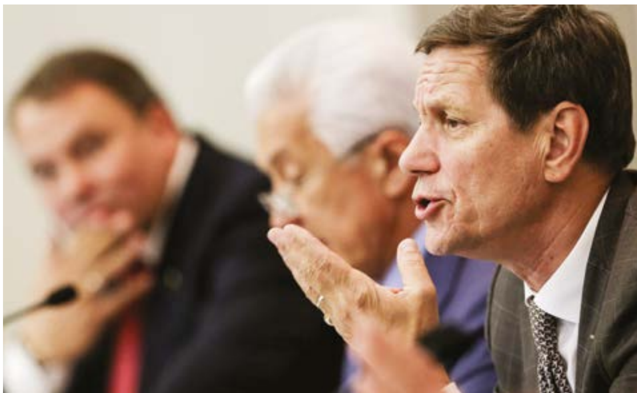
Первый заместитель Председателя Государственной Думы Александр Жуков