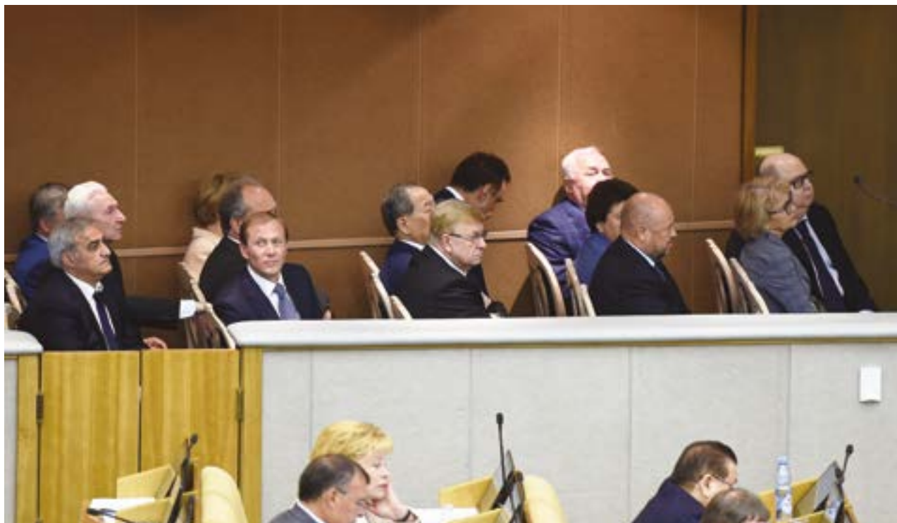
Аудиторы Счетной палаты на заседании Государственной Думы, посвященном отчету о работе Счетной палаты за 2016 год