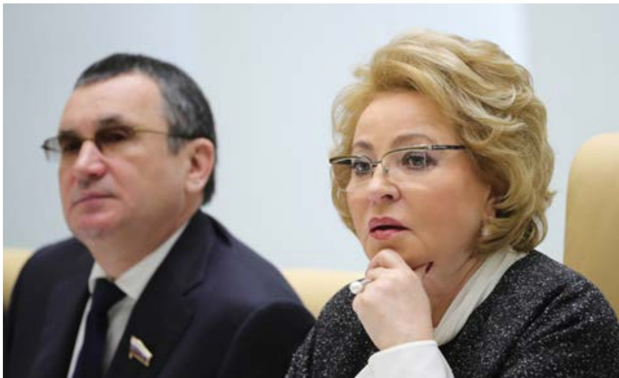
Председатель Совета Федерации Валентина Матвиенко