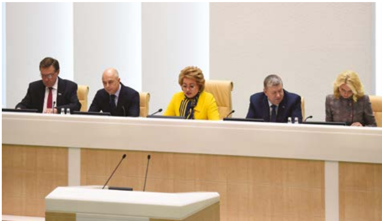
Парламентские слушания в Совете Федерации по теме «О параметрах проекта федерального бюджета на 2018 год и на плановый период 2019 и 2020 годов»