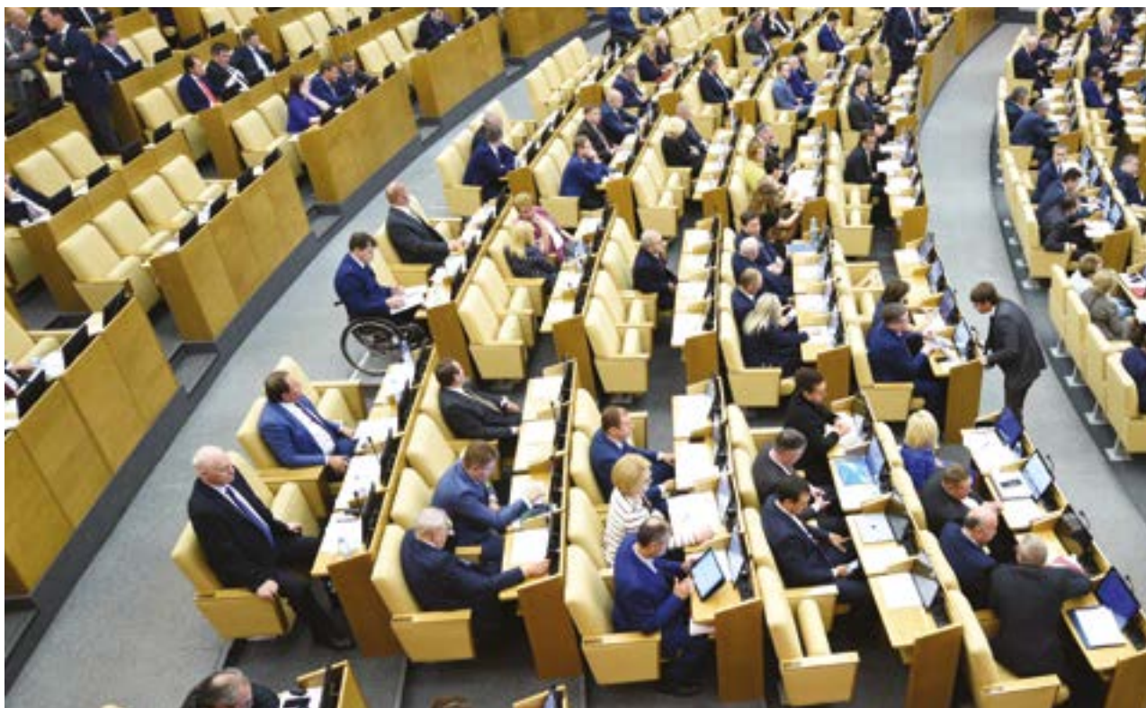
Заседание Государственной Думы по вопросу о работе Счетной палаты в 2016 году