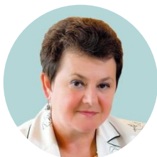
Светлана Орлова, аудитор Счетной палаты

В 2019 году целевой показатель достигнут. Вместе с тем, в связи с неблагоприятной эпидемиологической обстановкой, вызванной коронавирусной инфекцией, и, как следствие, возможным увеличением сроков строительства и снижением покупательной способности населения, достижение цели в 2020 году затруднено. Также отмечаются риски недостижения цели при несохранении финансирования, предусмотренного на 2020 год.