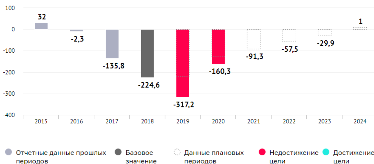
Естественный прирост (убыль) населения, тыс. человек

Эффект кризиса, вызванного распространением новой коронавирусной инфекции, пока что не отразился на демографических процессах. Но новые экономические проблемы (угроза безработицы, снижение доходов населения) могут дополнительно ухудшить ситуацию с рождаемостью.