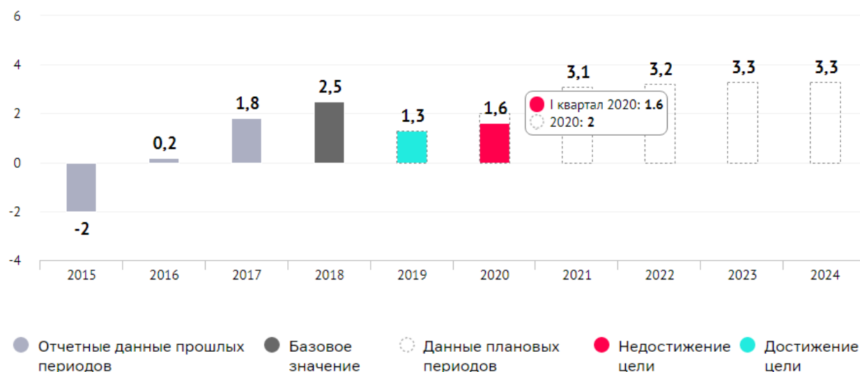
рост ВВП, %

«По наиболее оптимистическому прогнозу ожидается рост 3,5–4,5% в следующем году. Но я думаю, что он будет меньше и будет вызван эффектом низкой базы. И даже в этом случае мы не выйдем на уровень 2019 года. Есть мнение аналитиков, что по некоторым показателям мы только к 2023 году сможем выйти на уровень прошлого года. Поэтому экономический рост остается главной задачей и требует системного, комплексного подхода. До кризиса эти усилия были недостаточны, а уж теперь их надо еще серьезнее наращивать», – Председатель Счетной палаты Алексей Кудрин.